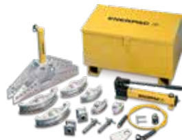
Curvadoras de tubos