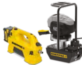
Bombas hidráulicas sin cable