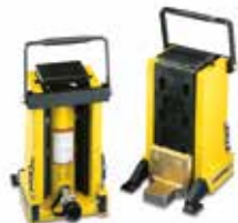
Gatos de maquinaria