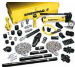
Kits de mantenimiento