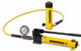
Conjuntos de cilindro-bomba