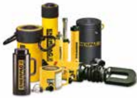
Cilindros y productos de elevación

Herramientas élite. Para profesionales de élite.